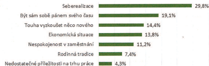
Co bylo hlavním důvodem založení podnikání

Nejčastějším důvodem založení podnikání byla uváděna seberealizace (29,8%). Okolo dvaceti procent podnikatelů chtělo být jednoduše pány svého času a přes čtrnáct procent chtělo vyzkoušet něco nového. Ekonomická situace a nespokojenost v zaměstnání vedly k založení podniku u téměř čtrnácti, respektive jedenácti procent respondentů. V menšině pak sehrála roli rodinná tradice (7,4%) a nedostatečné příležitosti na trhu práce (4,3%).